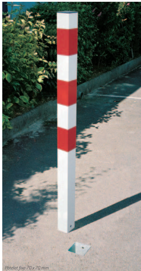
Potelet fixe 70 x 70 mm