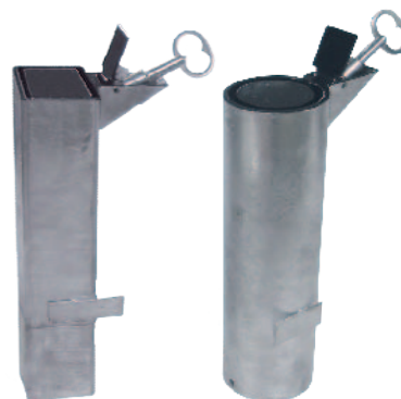
Fourreau verrouillable pour potelet 70 x 70 mm