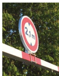
Option kit de fixation Panneau non fourni