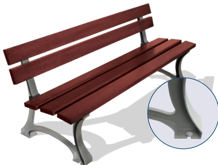
Longueur 2000 mm