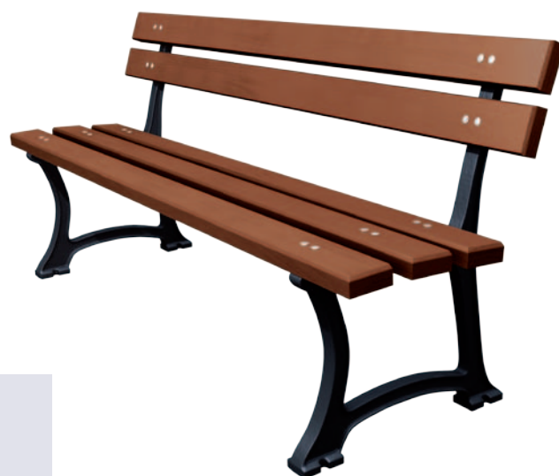
Longueur 1800 mm